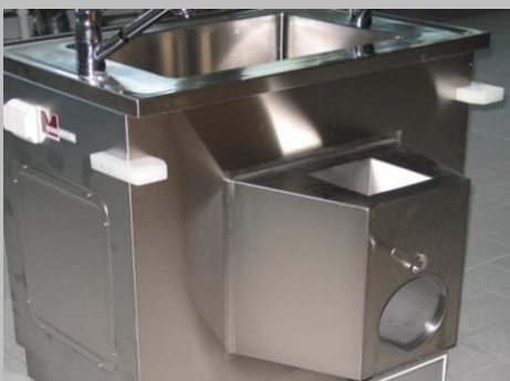
Einfach-Andocksäule für einen Präpariertisch

Hergestellt in Deutschland by Meissner Medical GmbH gemäß ISO 9001 und den gültigen EN-Normen sowie Arbeitsschutz- und Sicherheitsbestimmungen.