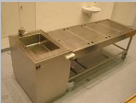
Perfusionstisch mit perforierter Arbeitsfläche und Absaugung nach unten mit Andocksäule

Beinfreiheit an jeder Seite des Tisches ca. 250 mm. Vier abdruckfreie Leichtlaufrollen (D=150 mm) mit Fixierung für Geradeauslauf. Gute und leichte und leichte Manövrierfähigkeit