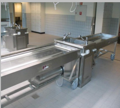
Studenten-Präpariertisch mit Transfer-Arbeitsfläche und Absaugung nach unten (Beispiel: Anatomie Trondheim / Norwegen)