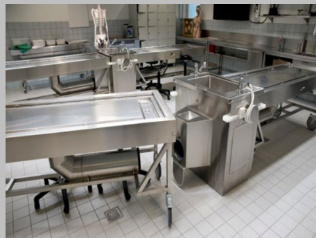
Mobiler Präpariertisch von der Andockstation getrennt